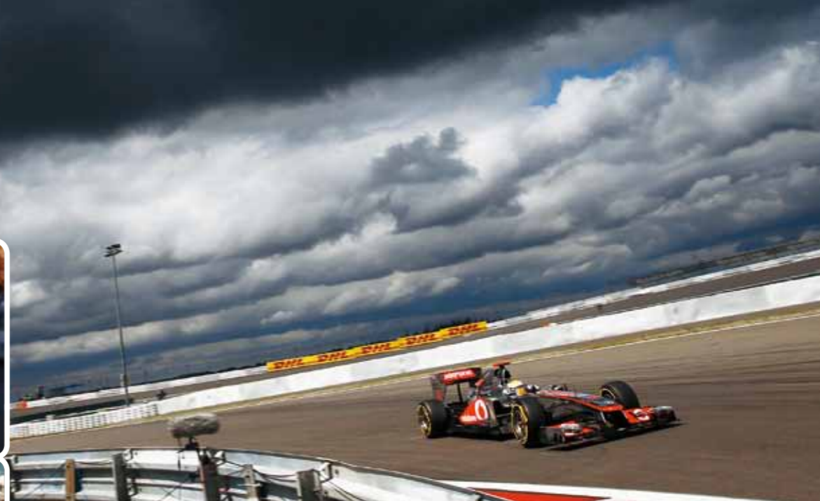
1. 红牛的维修间内弥漫着紧张的气氛 2. 德国站，维泰尔的伤心地 3. 迈凯轮“屠牛”成功 4. 骑在“牛”背上的阿隆索，神情依旧自若

最后几圈，维泰尔向马萨发起进攻，由于两人都没有进站，所以进站的时机成为比赛的关键。倒数第2圈，两人终于同时进站。红牛引以为傲的换胎效率再显神效，而法拉利轮胎上的新螺母出了问题，关键时刻螺母从气动扳手上掉下，损失了1.5s，导致马萨整场比赛的努力功亏一篑。