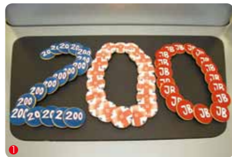
1. 200场分站赛，巴顿也算是“久经沙场”了 2. 海菲尔德匈牙利上演惊险一幕