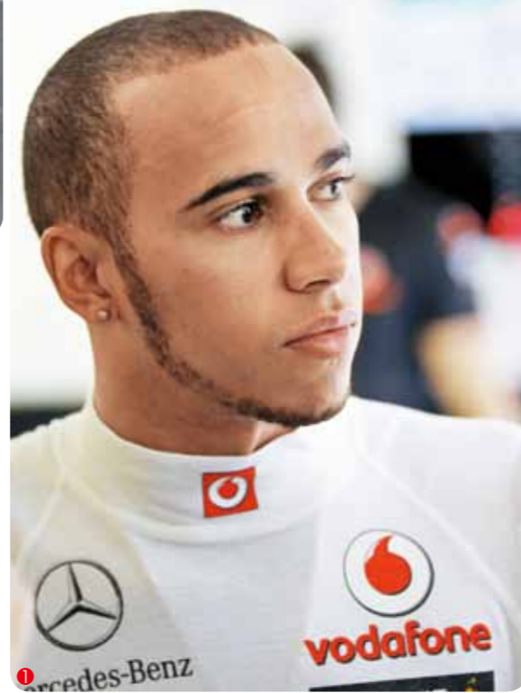
1. 汉密尔顿的眼神中流露出的是什么呢？不屑？ 2. 维泰尔：冠军奖杯，我不会善罢甘休……

汉密尔顿在匈牙利站的比赛中曾一度稳步领先，结果因为错误的轮胎策略加上被罚最终仅列第四。对此，小汉归结于无线电故障。“我们的无线电有问题，”汉密尔顿在赛后说道，“我能够听到我们的工程师说话，但是他们听不到我说话。我不断地询问信息，但是他们始终听不到我。我听到他说将要下雨了，而且已经开始飘落，所以我们选择了雨胎。”但是预期的雨并未降临，这次错误的决定，让汉密尔顿在随后不得不返回维修站换回干胎，时间损失惨重。