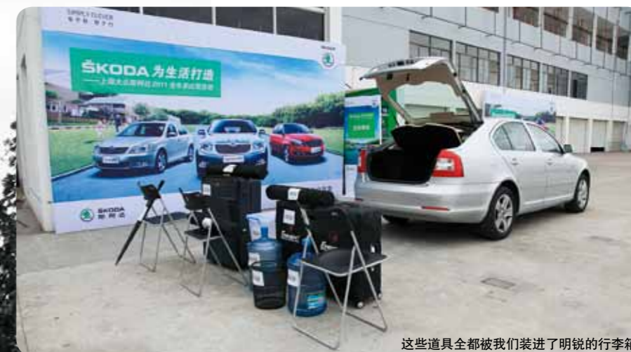
这些道具全都被我们装进了明锐的行李箱

心得体会：虽然明锐诞生于大众PQ35紧凑车型平台，但是明锐的空间还是比较宽敞的，如果合理摆放物品，其行李箱真的可以算是“大肚量”。通过这次比赛更激发我们遇事要勤于思考，生活中的美好往往也需要一双会发现的眼睛。